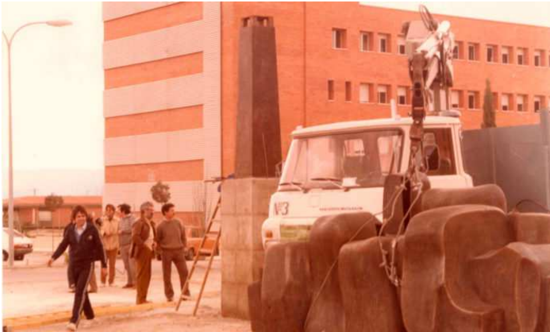
Las obra se colocó en 1985.

Ojeando y arreglando papeles, ya que tenemos mucho tiempo, me encuentro con fotografías de la instalación del monumento al sector del mueble que está en la redonda situada frente al edificio de la Feria del Mueble.